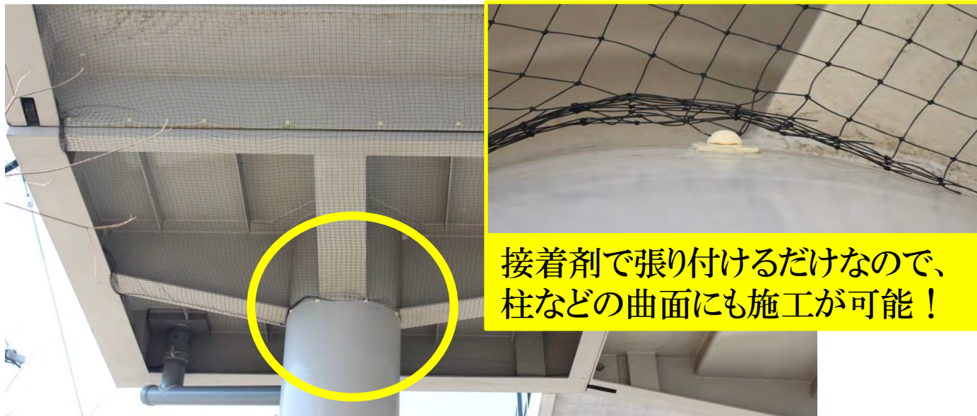
事例① 天満橋 宮崎市 国道269号線