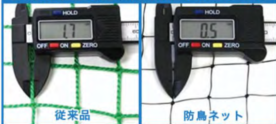
従来の屋外用の網と、防鳥ネットの太さの比較

Φ0.5mmの極細ネットなので目立 たず、景観・美観を損ないにくい！ 網目は20mm 2 と細かく、スズメなどの 小鳥も通れない！